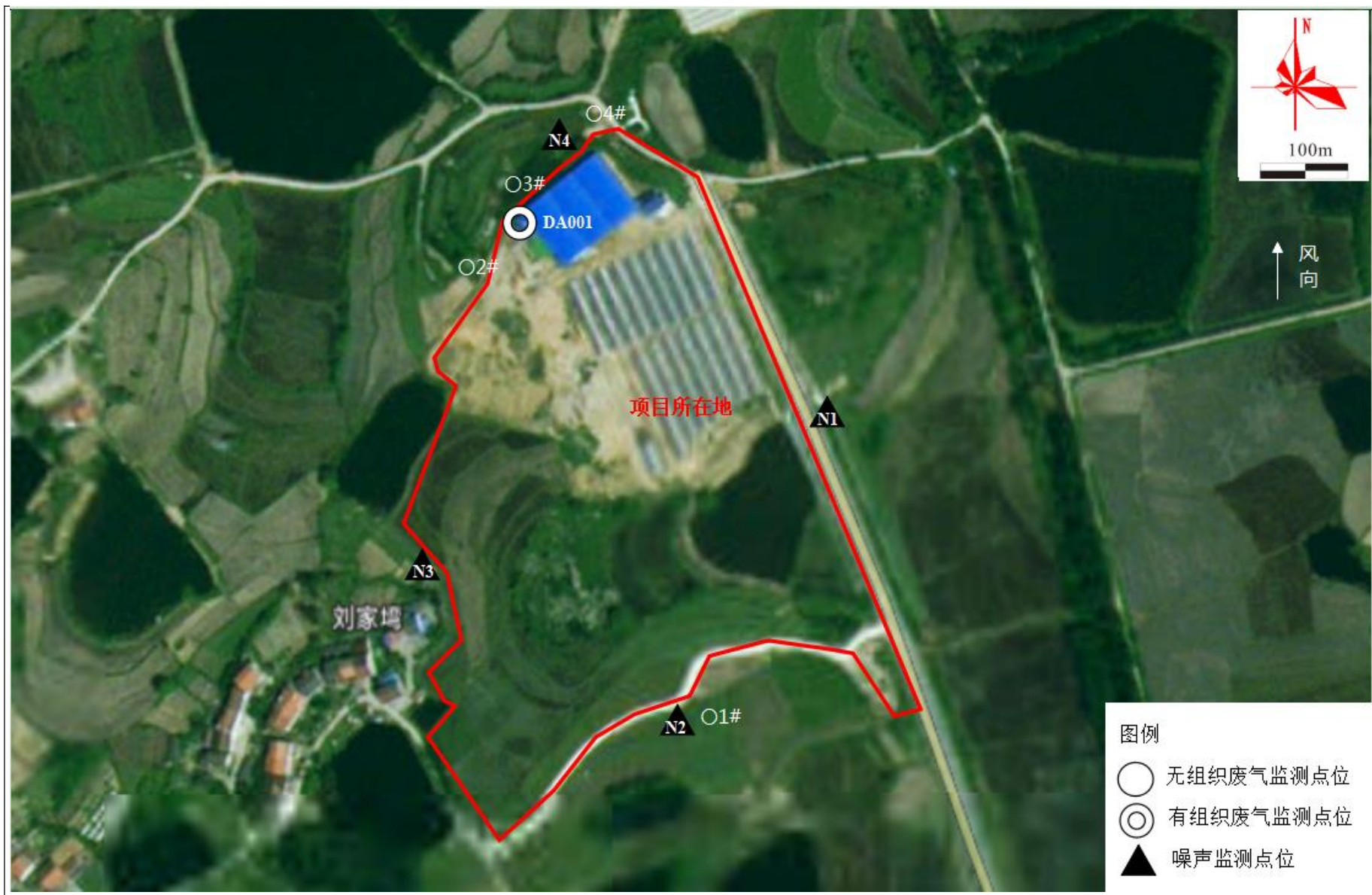
附图 4 项目监测点位图