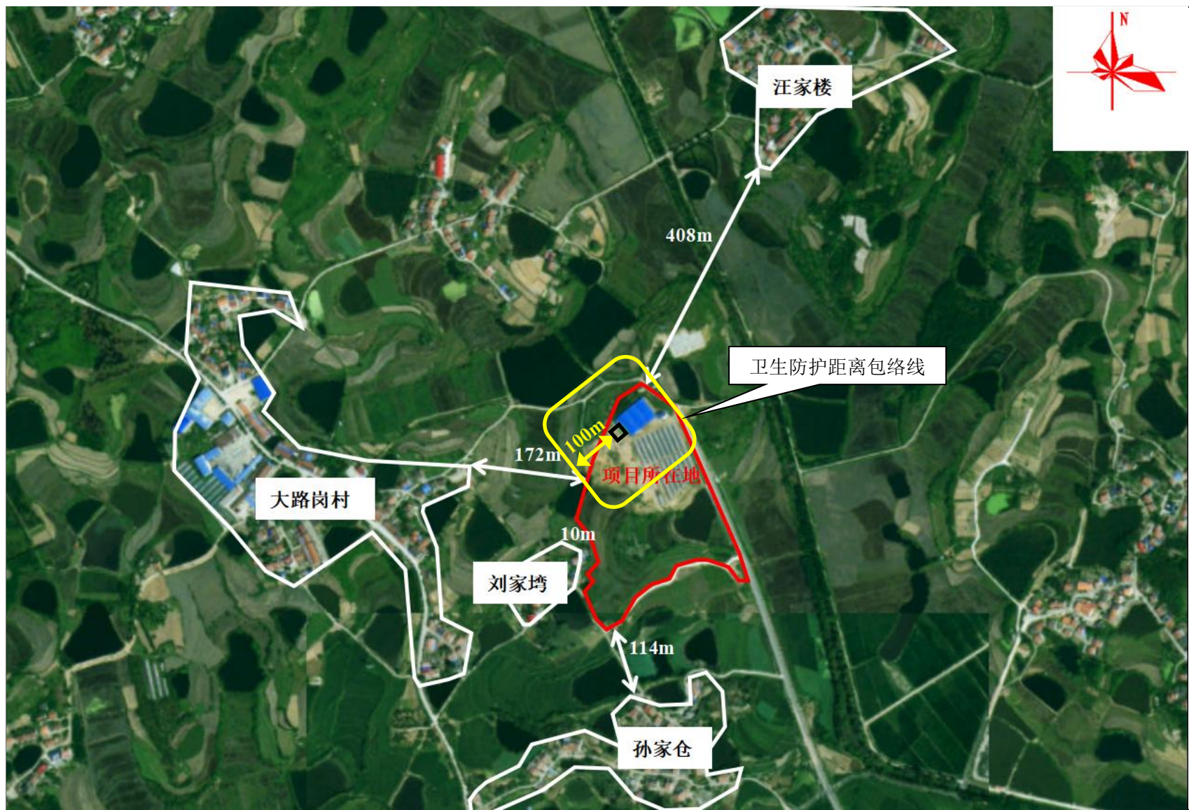
附图 5 项目卫生防护距离包络线图