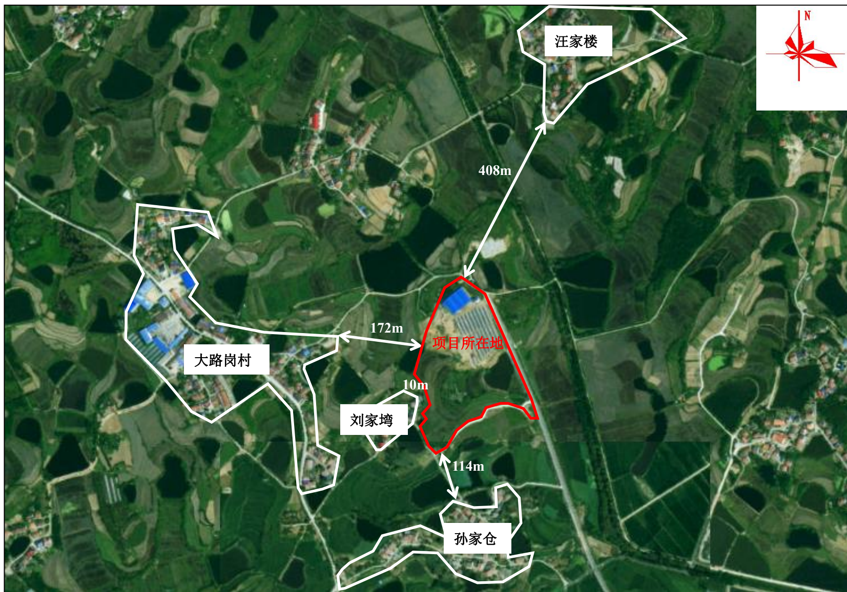
附图2 项目周边关系示意图