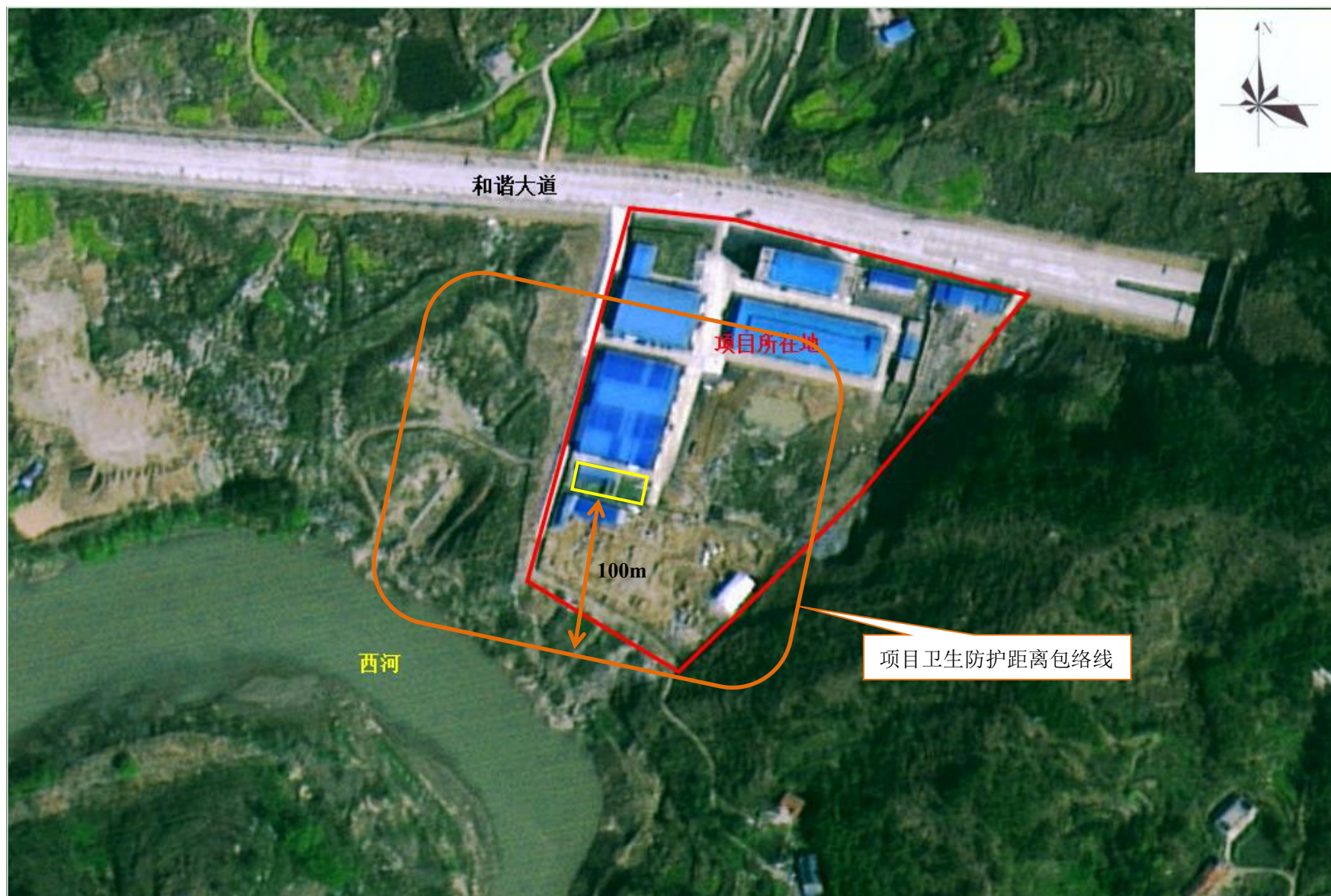
附图 5 项目卫生防护距离包络线图