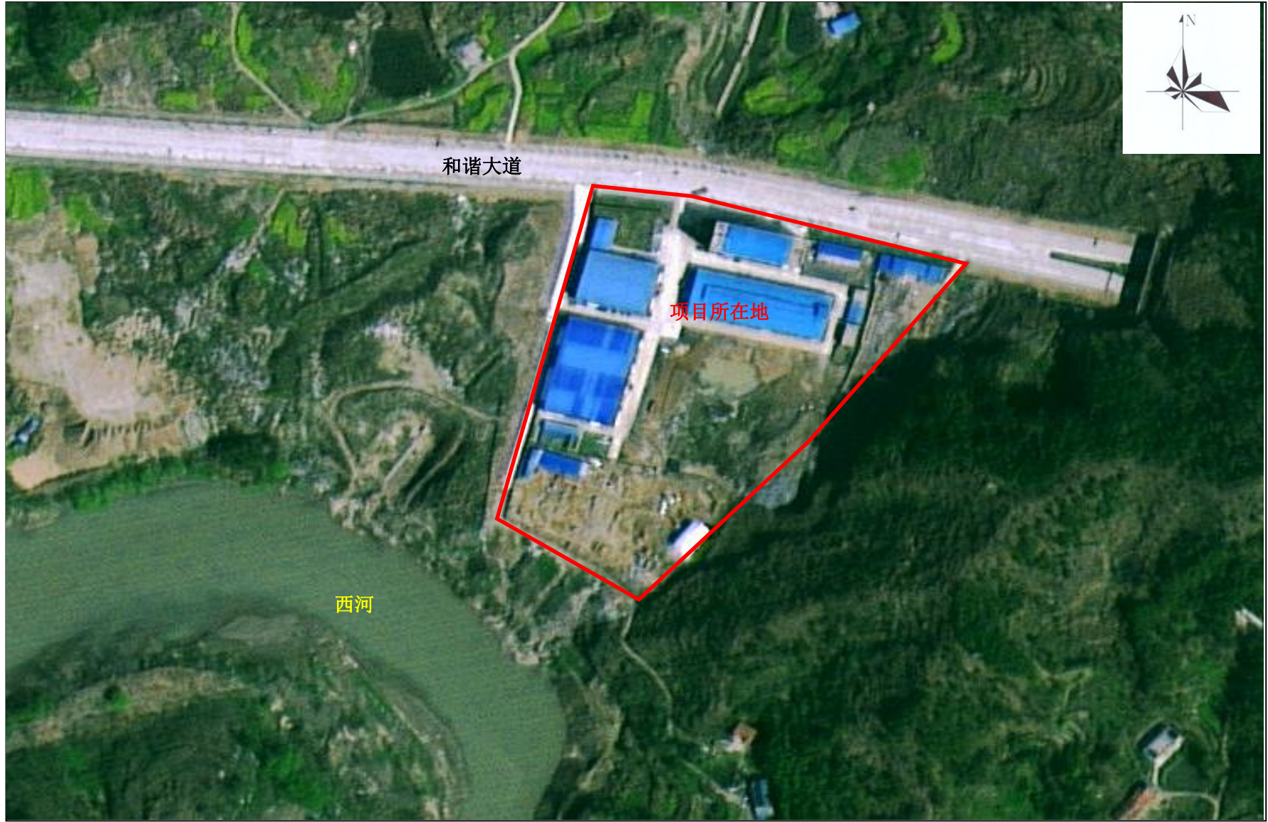
附图 2 项目周边关系示意图