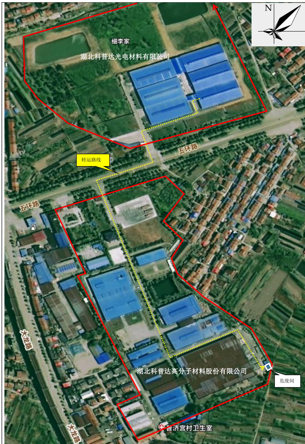
附图 4 项目危废内部转运路线图