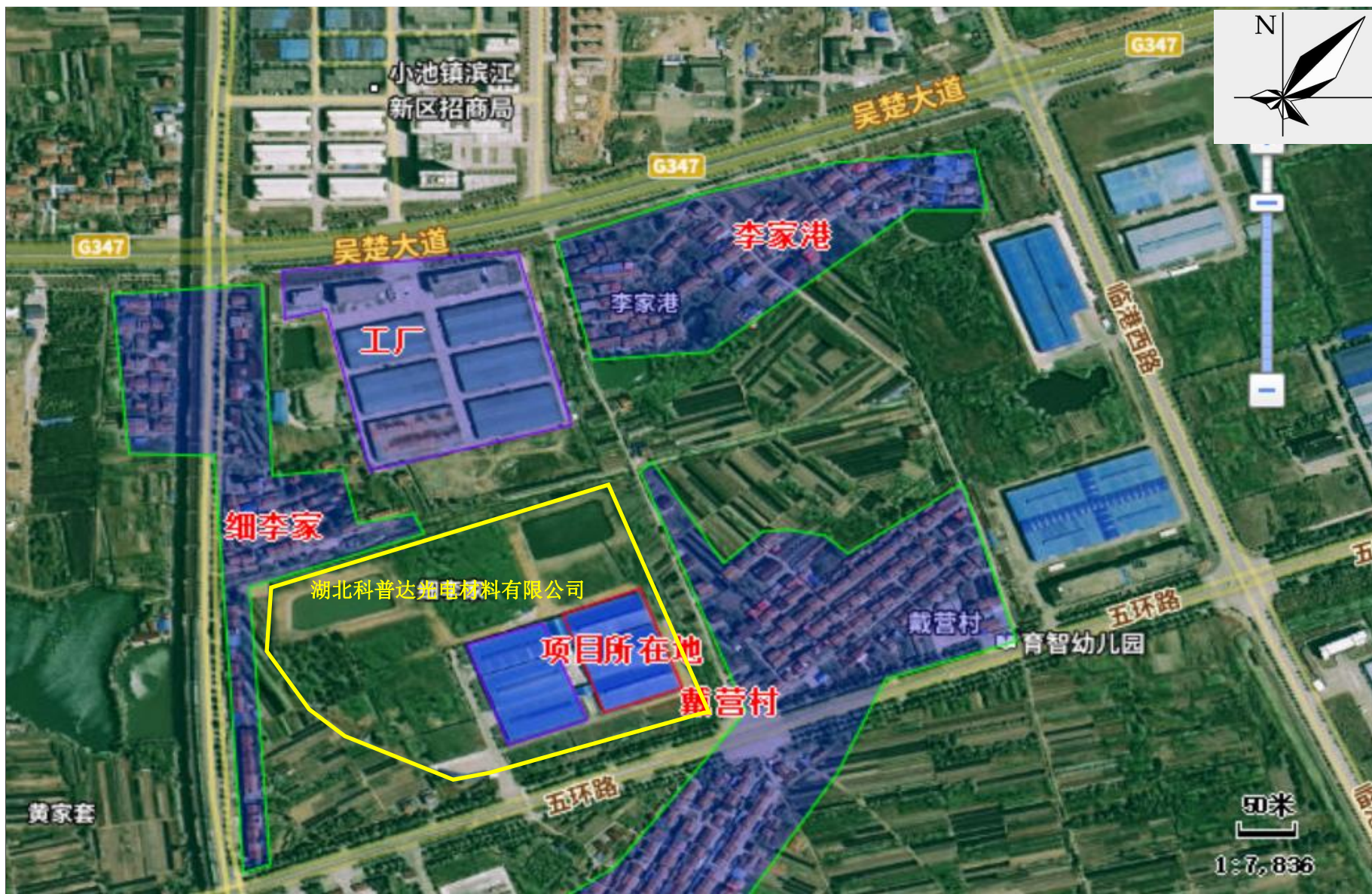
附图2 项目周边关系示意图