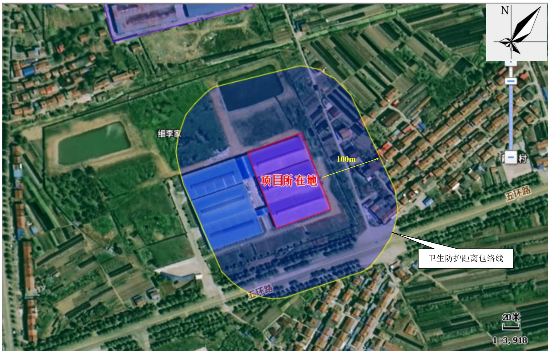
附图 6 项目卫生防护距离包络线图